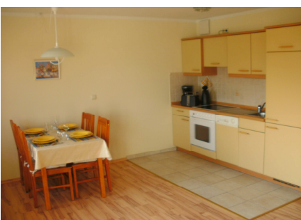
Küche mit Esstisch