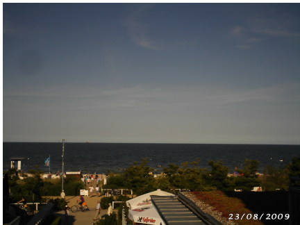
Bansin Blick zum Meer